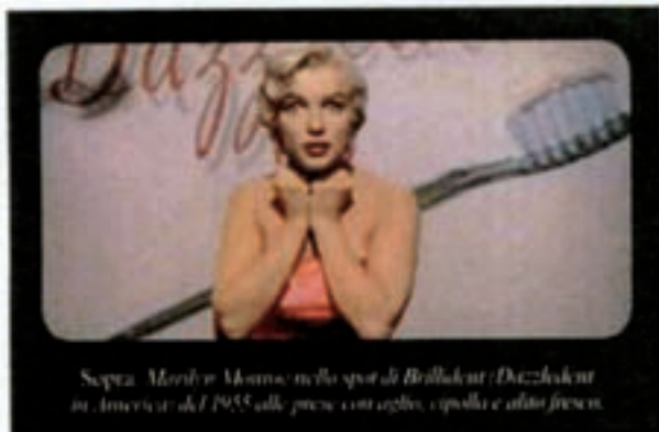
Sopra: Marilyn Monroe, nella spot di Bullseye (Dorland) in America del 1955, alle prese con aglio, cipolle e altro fresco.

«Sentirsi bene con se stesse. Ecco il valore del nostro secolo. E un bel sorriso regala fiducia». La dottoressa Gobbi punta molto su questo aspetto, così come è attenta alle esigenze di tempo, garantendo un miglioramento del sorriso e una riduzione dei difetti in tempi record. «Io li chiamo i ritocchi della pausa pranzo. Si arriva in studio verso le 13 e si esce alle 14.30 con una dentatura perfetta. Stamattina, per esempio, è venuta da me una signora con un'evidente diastema tra gli incisivi infe-